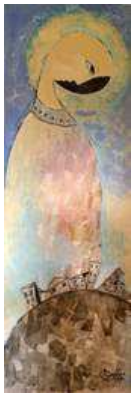
Georgi Guraspashvili: Trauriger Engel, 2016 40 x 120 cm Acryl auf Leinwand