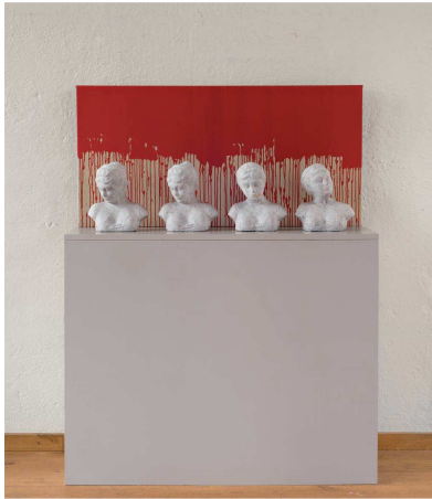
Dörthe Bäumer: Anmut von Ähnlichkeit und Differenz Installation mit Skulpturen aus Seidenpapier und Acryl auf Leinwand 2016 / 2017, 67 x 130 x 55 cm