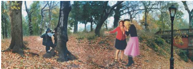
Genia Chef: „Schneeweißchen und Rosenrot im Central Park, N.Y.“ Lichtbox Holz 90 x 65 x 8 cm (3tlg.)