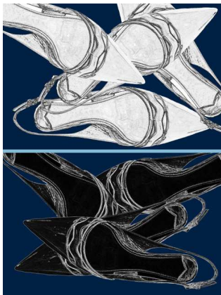
Marion Mandeng: There is a thin line between love and hate 2017 Foto auf Fujiflex Papier 60x80 cm Silberne Linie in glänzender Farbe Rahmen Holz schwarz