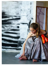
Karsten Hein: Titel: Triptych 2017 Foto 70x90 cm / Limitiert 10 Rahmen Holz weiß